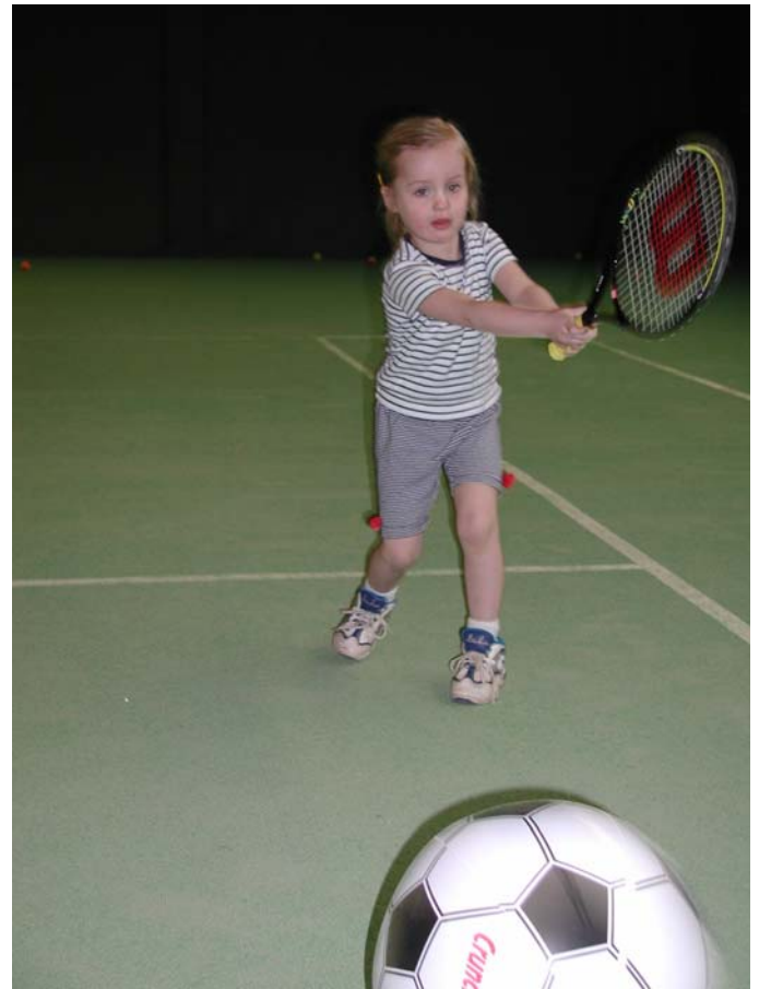
Spielerische Einführung des LOW-T-BALL-Spiels bei Kindergarten-Kindern in Bad Harzburg.

Wer in der Schule oder im Verein vor der Aufgabe steht, Tennis einzuführen, wird sich zunächst einmal Gedanken machen müssen, wie er die Kinder möglichst schnell für das Tennisspiel begeistern kann. Weiterhin sollen Überlegungen angestellt werden, wie man Spielsituationen möglichst ausschalten kann, welche die Kinder technisch überfordern. Hierzu sind Vereinfachungsstrategien dringend notwendig. Diese Strategien zum Erlernen der Sportart Tennis sollen helfen, dass vor allem durch die Medien in seiner „reinen“ Form inszenierte Spiel so darzustellen, dass ein Miteinander-