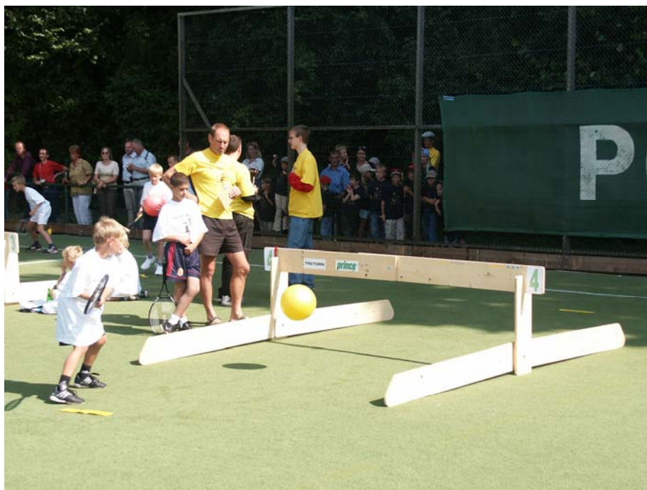
Mit LOW-T-BALL spielend zum Erfolg

Das Spielfeld ist aus der Vogelperspektive betrachtet ähnlich einem Tennisfeld, allerdings gibt es keine Ausgrenze. Die Spielidee besteht darin einen so genannten „Over-Ball“ mit einem Tennisschläger unter einem Brett hindurch zuschlagen. Der „Over-Ball“ ist aus Kunststoff gefertigt und hat einen Durchmesser von 26 cm und ist ideal geeignet für das LOW-T-Ball-Spiel.