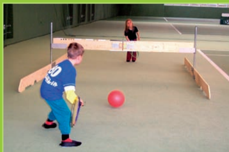
„Feuerball“ – Schnell weg mit der glühenden Kugel!