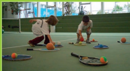
„Der erste Schultag“ – Schnell die Plätze tauschen, solange die Lehrerin schreibt!