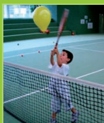
„Luftballonartist“ – Volle Konzentration für die artistische Leistung