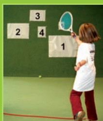
„Losbude“ – Mist! Schon wieder eine Niete!